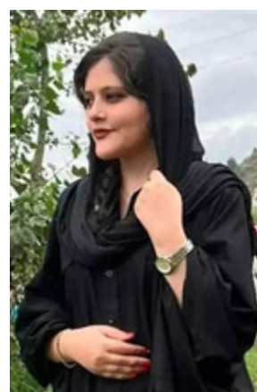
La dépouille de Mahsa Amini, 22 ans, arrêtée par la police des mœurs le 13 septembre 2022, avait été ramenée dans son village le 17 septembre.

Message écrit sur la stèle de Jina Mahsa Amini