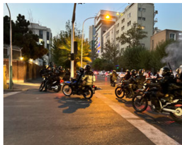
Téhéran (Iran), septembre 2022.

L'écho de ces obsèques, très politiques, est immédiat. Le 18 septembre, certains jour-